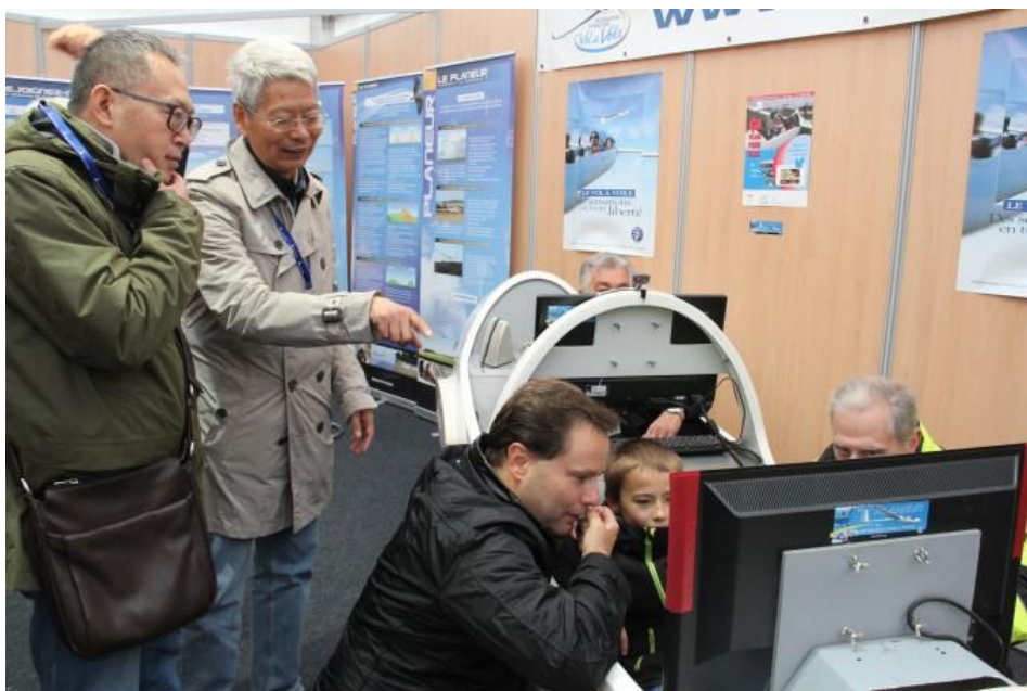
陕西中航气弹簧有限责任公司考察代表队

在张晓冬看来，目前几乎空白的中国大陆通航领域势必在未来与国际接轨。近几年来，从中国低空空域管理改革意见，中国国务院关于促进民航业发展的若干意见，到中国通用航空飞行任务审批与管理规定，中国正逐步打开政策上的桎梏枷锁；而交通运输的转性需求也在稳步推动通航的发展：根据中国民用航空局消息，截至 2020 年，中国全国 80% 以上的县级行政单元应可在地面交通 100 公里或 1.5 小时车程内享受到航空服务，所服务区域的人口数量占全国总人口的 82%，这一切都将未来发展的方向指向了通航领域的潜力释放。